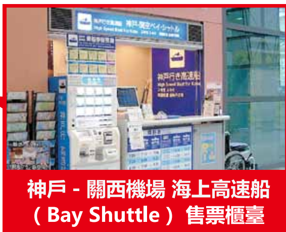
神戶 - 關西機場 海上高速船 (Bay Shuttle) 售票櫃檯