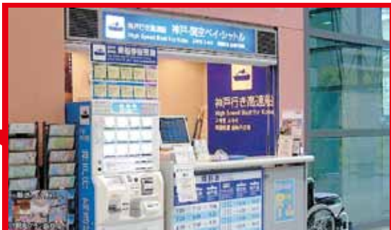
神户-关西机场海上高速船 ( Bay Shuttle ) 售票柜台